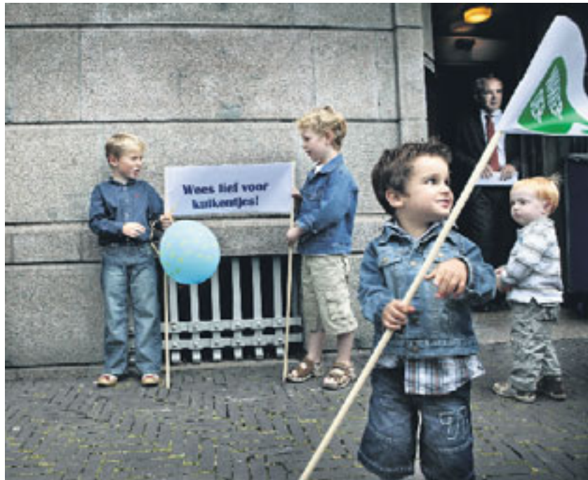
Wees lief voor kuikentjes (en de peutertjes dan...?)